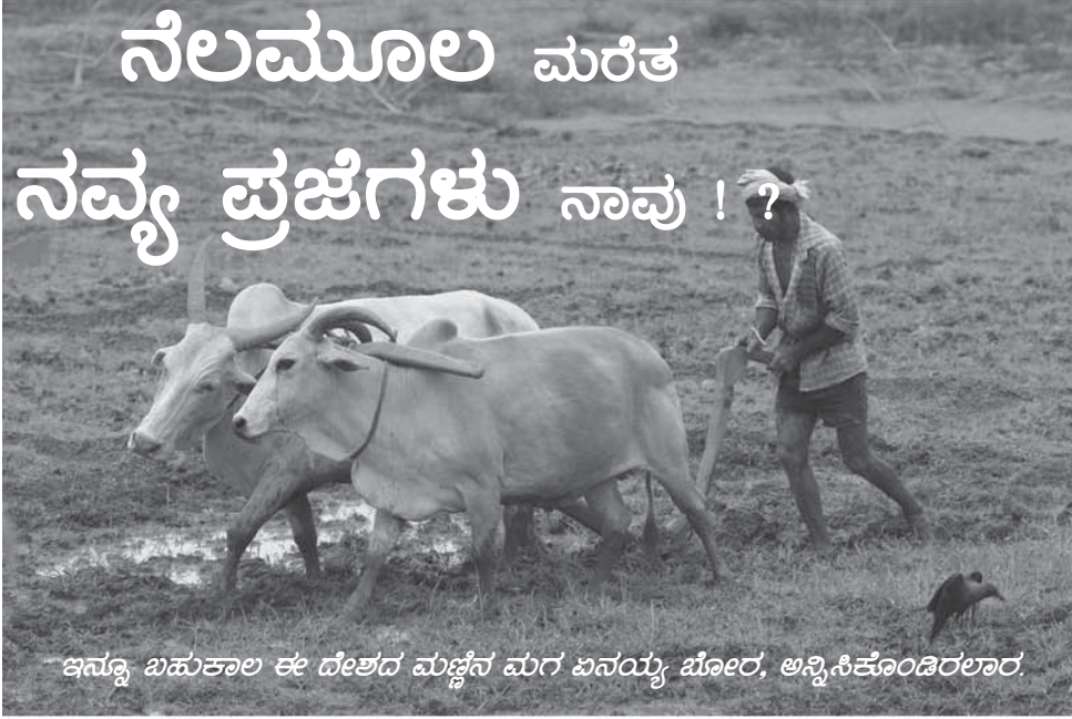
ಇನ್ನೂ ಬಹುಕಾಲ ಈ ದೇಶದ ಮಣ್ಣಿನ ಮಗ ಏನಯ್ಯ ಬೋರ, ಅನ್ನಿಸಿಕೊಂಡಿರಲಾರ.