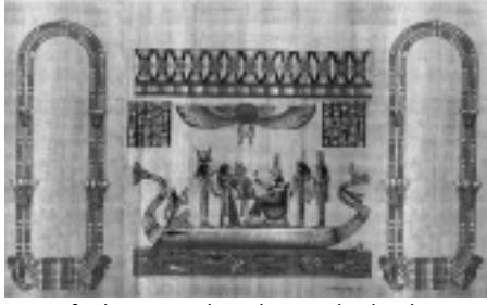
ಪೇಪರ್(ಪ್ಯಾಪಿರಸ್)ನ ಚಿಹ್ನೆಯ ಮಾದರಿ

ಇನ್ನು ಅಲ್ಲಿನ ಜನಗಳ ಮತಶ್ರದ್ಧೆ ಮೆಚ್ಚಲೇಬೇಕಾದದ್ದು. ದಿನಕ್ಕೆ ಐದು ಬಾರಿ ನಮಾಜ್ ಮಾಡಲೇಬೇಕೆಂಬ ನಿಯಮವನ್ನು ಪ್ರಾಯಶಃ ಎಲ್ಲ ಮುಸ್ಲಿಮರು ಪಾಲಿಸುತ್ತಾರೆಂದೆನಿಸುತ್ತದೆ. ಕಚೇರಿಗಳಲ್ಲರಲ, ರಸ್ತೆಯೆಲ್ಲರಲ ಆ ಸಮಯಕ್ಕೆ ಸರಿಯಾಗಿ ಮೆಕ್ಕಾ ಇರುವ ದಿಕ್ಕಿಗೆ ತಿರುಗಿ ನಮಾಜ್ ಮಾಡುತ್ತಾರೆ. ದಿನಕ್ಕೆ ಐದು ಬಾರಿ!!!